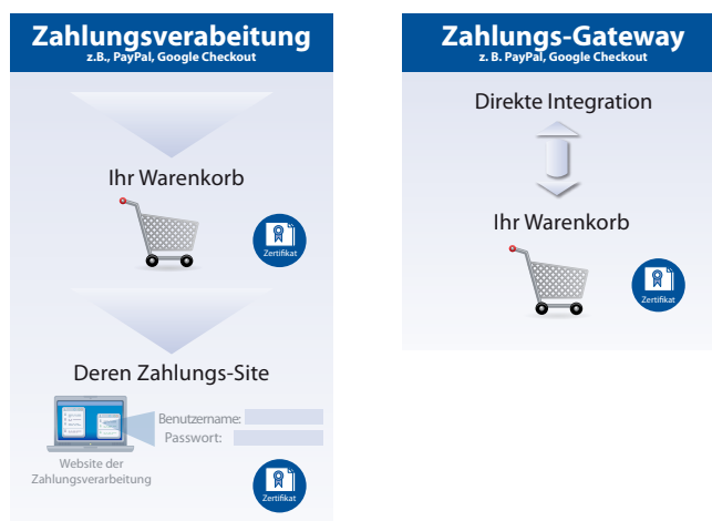
Diagramm 1. Flussdiagramm zur Zahlungsverarbeitung auf einer E-Commerce-Website

Denken Sie auch daran, Ihre Metadatenfelder mit relevantem Inhalt zu füllen und Ihre Site an Open Directory Project , Google , Yahoo , Bing und andere populäre Suchmaschinen zu senden, damit Ihre Kunden Sie finden können.