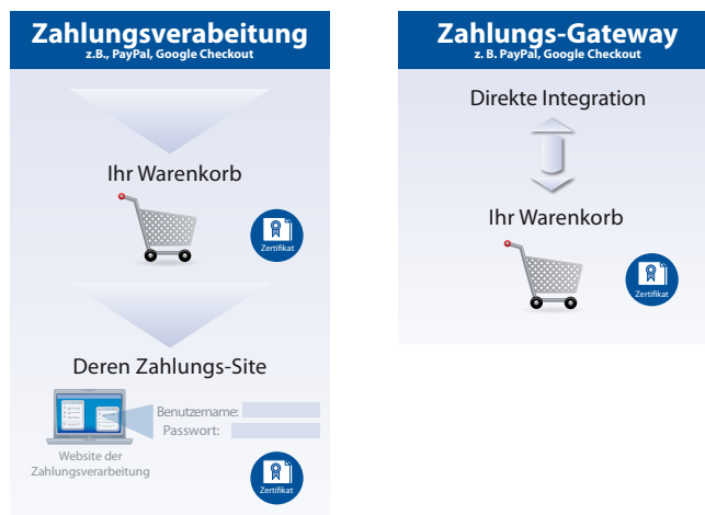
Diagramm 1. Flussdiagramm zur Zahlungsverarbeitung auf einer E-Commerce-Website

Denken Sie auch daran, Ihre Metadatenfelder mit relevantem Inhalt zu füllen und Ihre Site an Open Directory Project , Google , Yahoo , Bing und andere populäre Suchmaschinen zu senden, damit Ihre Kunden Sie finden können.